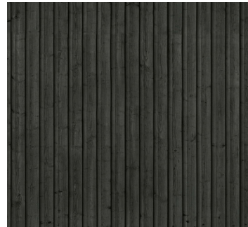
Facader: Sort træbeklædning, lodret fer/not