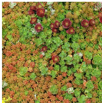
Tag på carport/skur Tagpap med mulighed for sedum